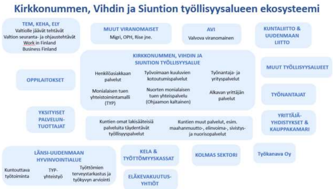
Kuva 4. Kuvaus tulevan työllisyysalueen mahdollisesta ekosysteemistä

Sekä paikallisten yrittäjäyhdistysten että työllistymistä ja kotoutumista edistävien järjestöjen, yhdistysten ja yhteisöjen kanssa käydyissä keskusteluissa korostui sujuvan yhteistyön merkitys, mukana olo suunnitteluvaiheessa, ajankohtaisista asioista tiedottaminen sekä ennakointi, jotta toimijoilla on mahdollisuus reagoida tuleviin muutoksiin riittävän ajoissa.