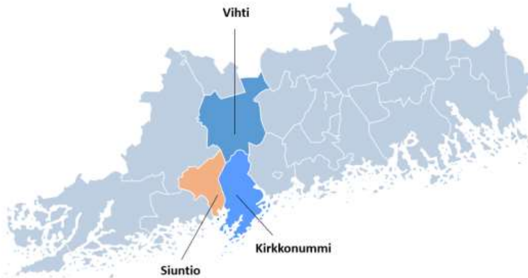
Kuva 1. Kirkkonummen, Vihdin ja Siuntion kunnat Uudenmaan kartalla.