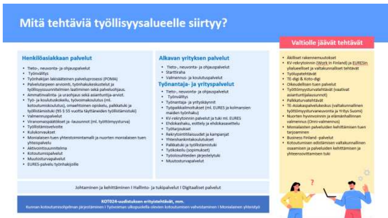
Kuva 2. Työvoimapalvelu-uudistuksessa siirtyvät tehtävät.