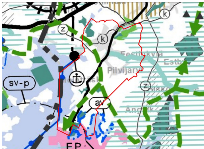
OTE UUSIMAA 2050 KAAVASTA

Suunnittelualuetta koskee Uusimaa-kaavan 2050 Helsingin seudun vaihemaakuntakaava. Maakuntavaltuusto hyväksyi kaavakokonaisuuden 25.8.2020 ja maakuntahallitus päätti kaavojen voimaantulosta 7.12.2020. Niistä on tehty useita valituksia, joiden perusteella on muutoksenhakuviranomaisena toimiva Helsingin hallinto-oikeus väli-päätöksillään 22.1.2021 kieltänyt niiden täytäntöönpanon. Helsingin hallinto-oikeus on 24.9. antamallaan kolmella päätöksellä hylännyt pääosan Uusimaa-kaava 2050 -kokonaisuuden hyväksymiseen kohdistuneista valituksista. Kaavakokonaisuuden täytäntöönpanokieltö ei ole enää voimassa hylättyjen valitusten osalta.