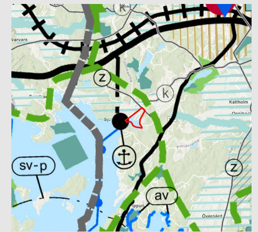
Situation för landskapsplanen