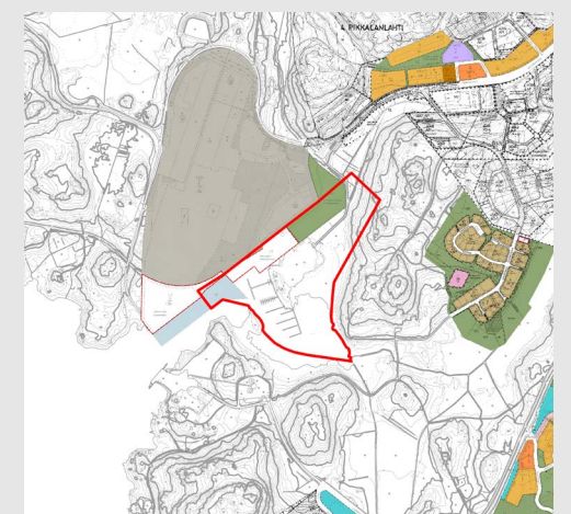
Planläggningssituationen i närområdet