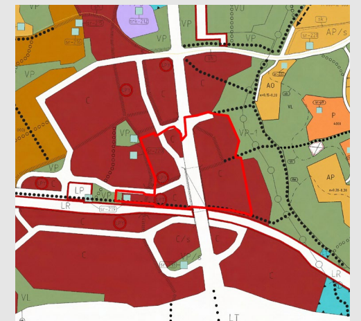
Kuntakeskusten 1. vaiheen osayleiskaava