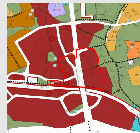
Kommuncentrum delgeneralplan, etapp 1.