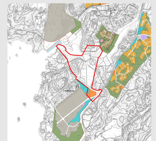
Ote lähialueen kaavatilanteesta