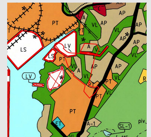
Kirkkonummen yleiskaava 2020