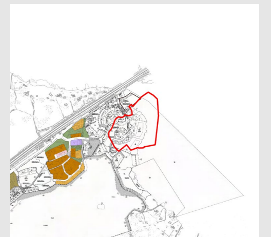
Planläggningssituationen i närområdet