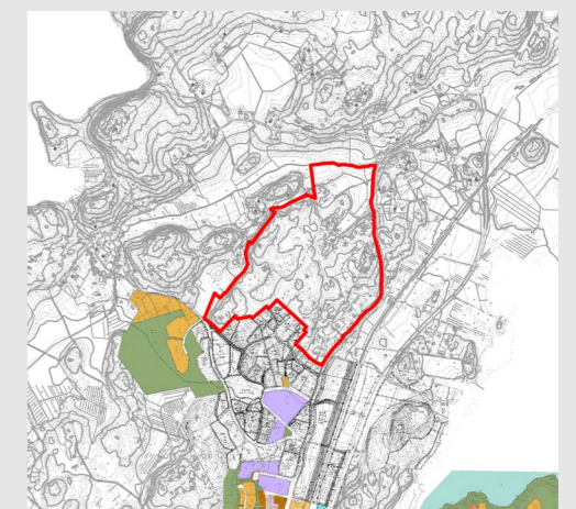
Planläggningssituationen i närområdet