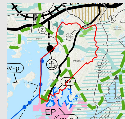
Situation för landskapsplanen

och 2060. Med hjälp av den styrande inverkan av båda handlingarna försöker man upprätthålla de offentliga tjänsterna på Kantviks delgeneralplansområde samt utveckla dem i rätt tid på ett ekonomiskt förnuftigt sätt.