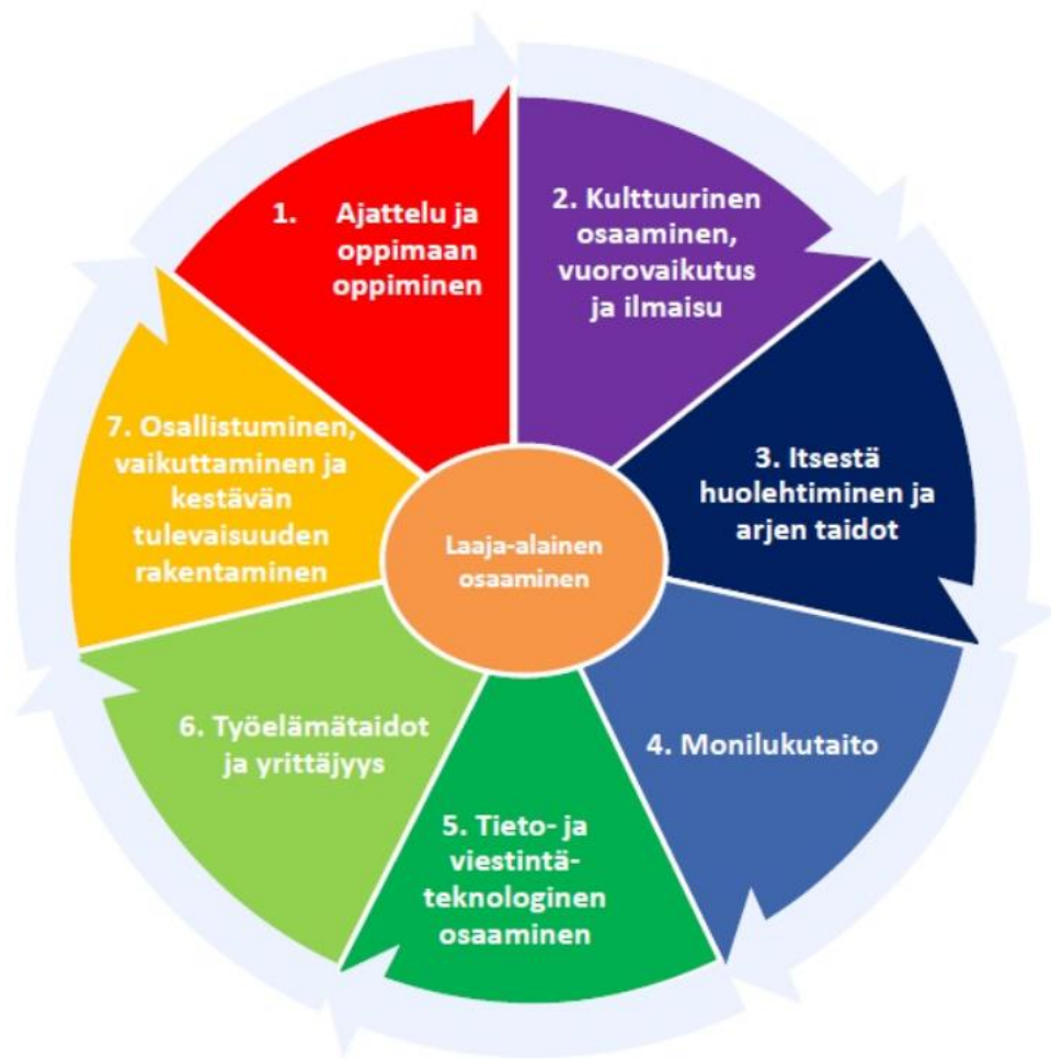
Laaja-alainen osaaminen (OPS 2016)