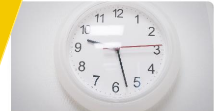
Varhaiskasvatusajan ilmoittaminen ja muuttaminen