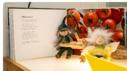
Ansökan till småbarnspedagogik