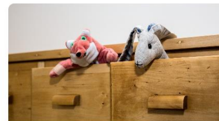
Ansökan till förskoleundervisningen