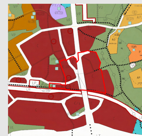
Kommuncentrum delgeneralplan, etapp 1.