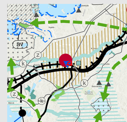
Situation för landskapsplanen